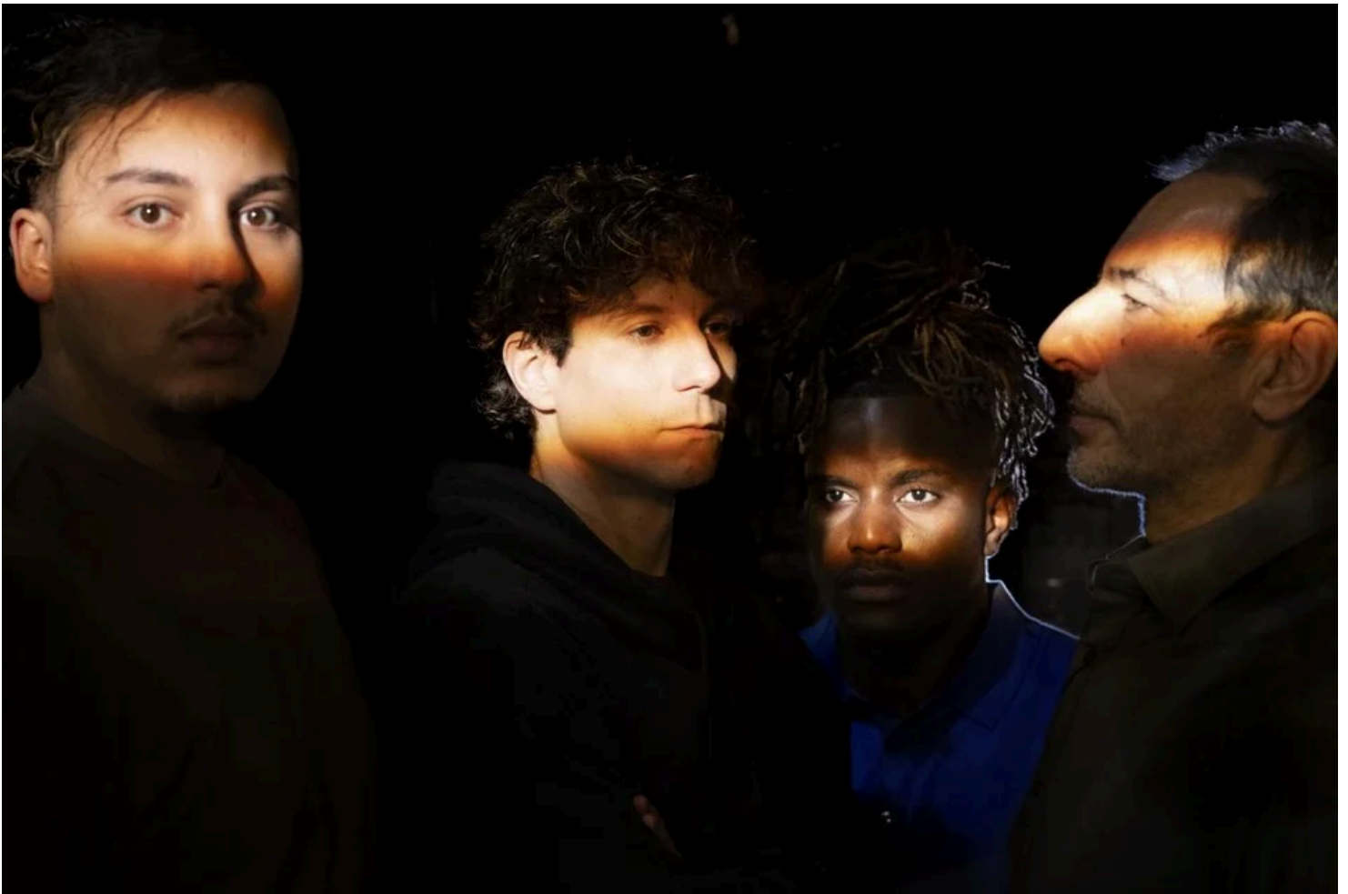
De cast van 'De gevangenis'.

“Een deel van de cipiers is menselijker geworden. Wellicht door opleiding, maar ook door de tijdgeest. Toch kun je ook nog altijd op een gemankeerde flik botsen, die op jou zijn frustratie afreageert. Zelf heb ik de laatste vijftien jaar wel nooit nog problemen gehad met de cipiers. De eerste tien jaar was dat veel moeilijker.”